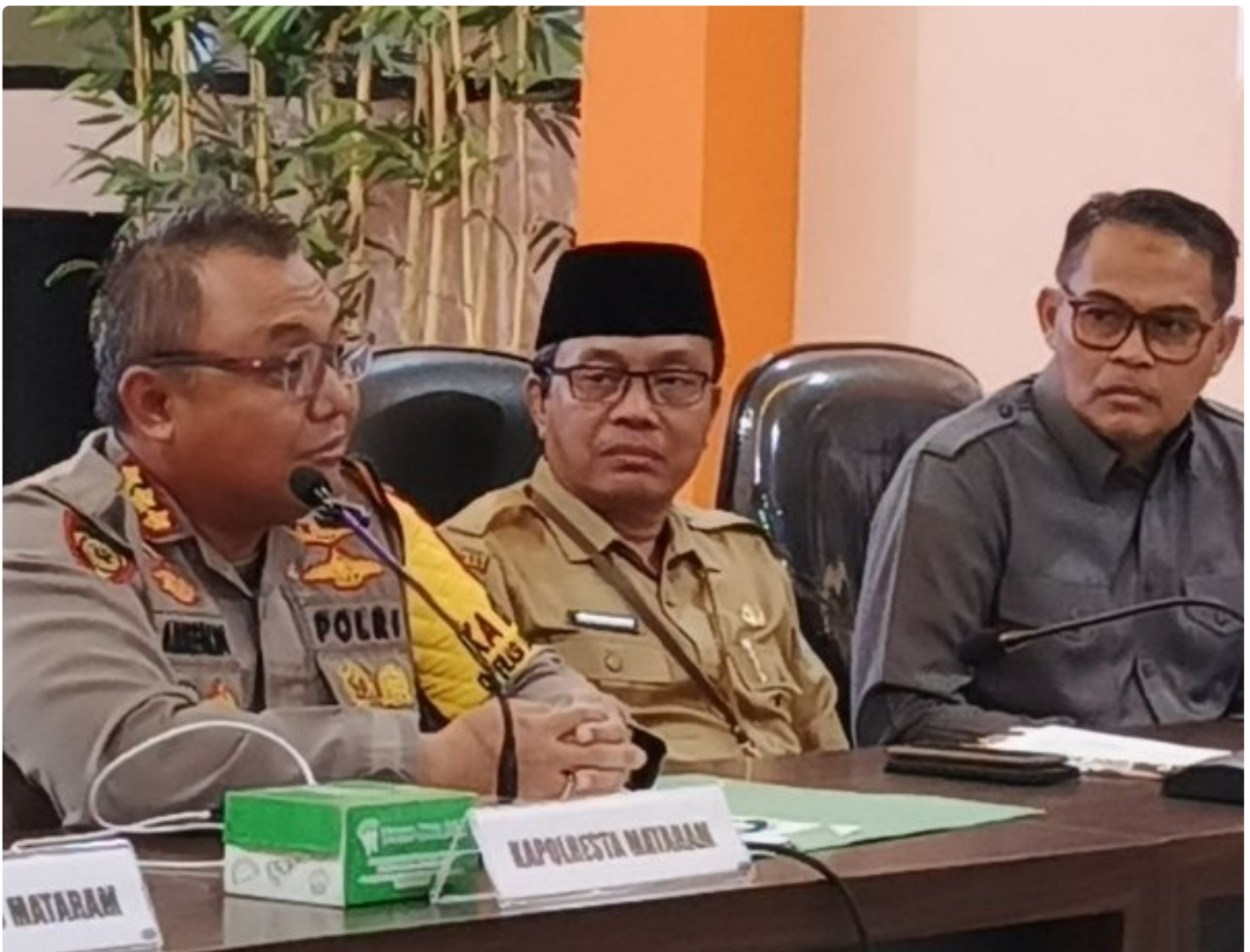
Kapolresta Mataram (Kiri) saat memimpin Konferensi pers akhir tahun, Selagi (31/12/2024)